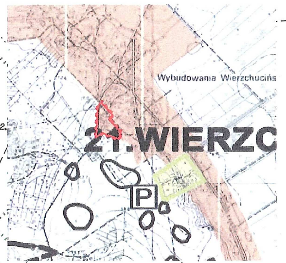
WYRYS ZE STUDIUM UWARUNKOWAŃ I KIERUNKÓW ZAGOSPODAROWANIA PRZESTRZENNEGO Z OZNACZENIEM GRANIC OBSZARU OBJĘTEGO PROJEKTEM PLANU